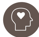
Indvirkning på livskvalitet