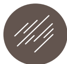
Hyppighed af kløe