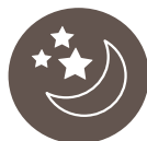
Indvirkning på søvn