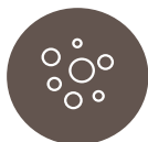
Sværhedsgraden af hudlæsioner